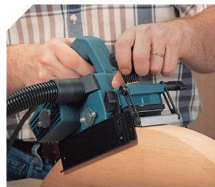
Hobeln konvexer Flächen.