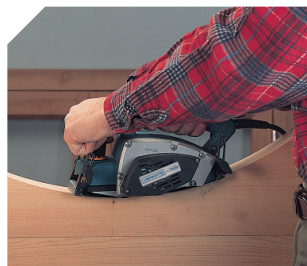
Hobeln konkaver Flächen.