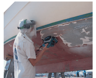
Hobeln von Flächen.