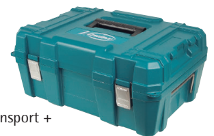
Koffer Transport +

3540118 Set mit 2 Stk. HM-Wendemessern 3531019 Set mit 2 Stk. HSS-Wendemessern 2040172 Set mit 10 Stk. HM-Wendemessern 3599101 Set mit 2 Keilleisten