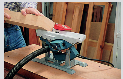
Stationäreinrichtung zur Verwendung des Hobels auf einer Werkbank (Sonderzubehör).