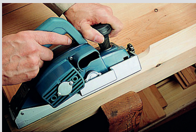
Speziell entwickelt zum Anfasen von Kanten.