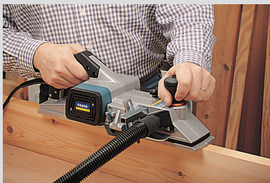
Absaugstutzen zum Anschluss einer externen Absaugvorrichtung.

HM-Wendemesser, Koffer Transport +, Staubabsauganschluss