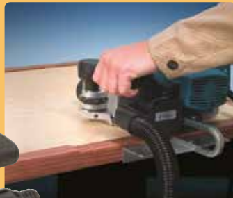
CE23N und CE123N Einhand-Schleifhobel u. Bootschleifhobel