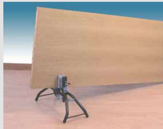
Erleichtert das Arbeiten an Türen und ermöglicht eine schnelle und sichere Fixierung.