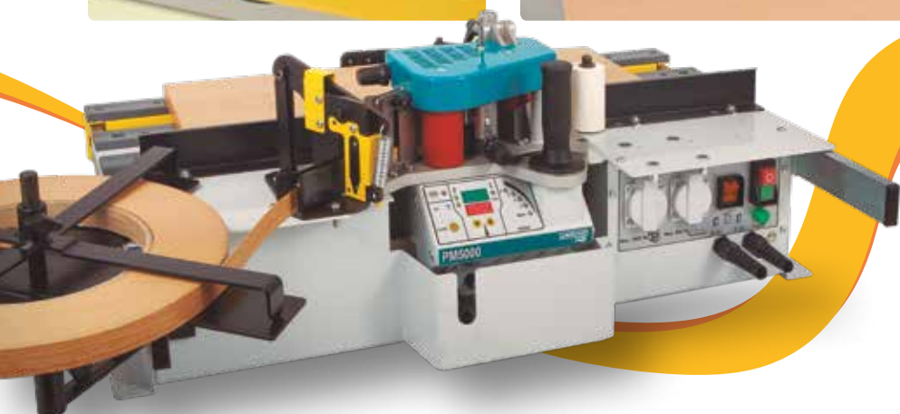
Rückwärtige Anschlusseinheit der PM5000 mit Rollenhalter