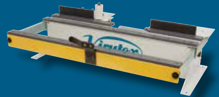
5046586 MEB250A Stationär Tisch mit automatischem Kantenabschneidegerät und Rollenhalter