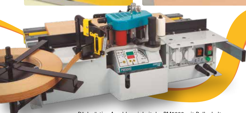
Rückwärtige Anschlusseinheit der PM5000 mit Rollenhalter