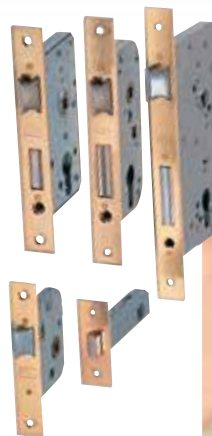
Montage verschiedenster Schösser mit der FC116U

Speziell entwickelt für rasches, präzises Ausfräsen von Beschlagbändern (Schlosskästen) an Türen oder anderen Elementen, auf der Baustelle oder in der Werkstatt. Dank des Spezialbefestigungssystems können Langlöcher in bereits eingehängte Türen gefräst werden, ohne deren Oberfläche zu beschädigen. Die rasche Maßjustierung erlaubt das Herstellen mehrerer Langlöcher in Rekordzeit. Es kann das vordere Drückerschild (Stulp) gefräst werden, indem der Fräser ausgetauscht wird. Die Bohrschablone U16I (Standardzubehör) ermöglicht es, Bezugslöcher für das Klinkenloch und den Schließzylinder zu bohren. Horizontales Arbeiten möglich. Für das Fräsen von Türen mit Falz oder solcher mit einer Überlappung gibt es ein Justiersystem zum Zentrieren der Maschine. Passende Fräser sind preisgünstig und einfach austauschbar, da sie auf derselben Werkzeugwelle montiert werden können.